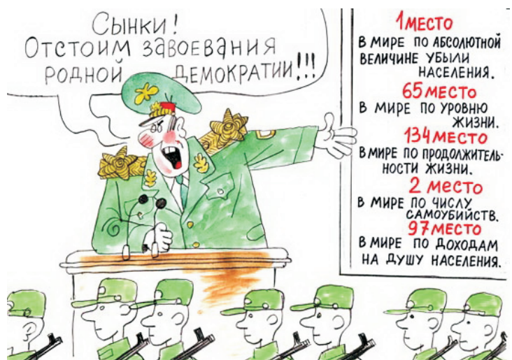
Рисунок Вячеслава ПОЛУХИНА