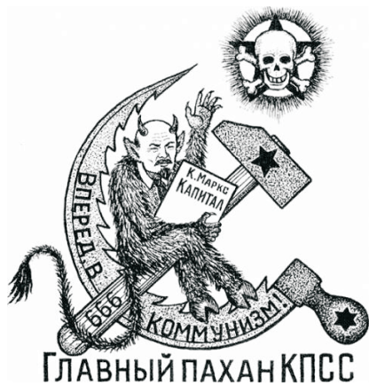
Татуировка советских политзаключённых

Сколько раз в разных официальных кабинетах, у главного редактора журнала, скажем, у секретаря райкома, в облисполкоме, в застеклённых шкафах я видел ровные, тёмно-бордовые, тёмно-синие ряды книг, к которым и подходить близко не нужно, чтобы сразу отметить – Ленин . Знали уж собрания его сочинений, узнавали издалика по внешнему виду безошибочно, как, взглянув на тот же Мавзолей на Красной площади, никто не спутает его с каким-нибудь другим зданием. Держать собрание сочинений Ленина каждому большому начальнику (директору завода, генералу какому-нибудь) считается не то чтобы обязательно... но как-то солидно и внушительно: письменный стол с телефонами, а около боковой стены застеклённый шкаф с томами Ленина. Много их стоит у разных людей, в разных кабинетах, но не многие Ленина читали. Если же кружки по изучению первоисточников, партучёба и семинары, то как-то так получается, то начинают всё время с ранних работ: «Материализм и эмпириокритицизм», «Что делать», «Что такое друзья народа и как они воюют против социал-демократов». Пока обучающиеся продерутся сквозь философские дебри этих работ, пока конспектируют, глядь, а семинарский год уже кончился, так что ни на одном семинаре, ни на одной партучёбе никогда дело не доходит до поздних его томов,