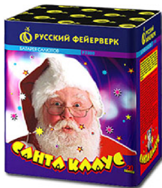
Русский фейерверк «Санта Клаус», ну не бред?

P.S. Отношение к Санта Клаусу. Во многих статьях, размещённых в Интернете, можно прочитать следующее утверждение: «Дед Мороз не одинок, у него есть родственники во многих странах. Самым близким и важным из них является Санта Клаус. А история Санта Клауса, как и Деда Мороза, начинается со Святого Николая». Это наглая ложь! Дед Мороз не является родственником Санта Клауса и наш Дед гораздо старше Святого Николая, о чём вы узнаете более подробно, прочитав данную статью целиком.