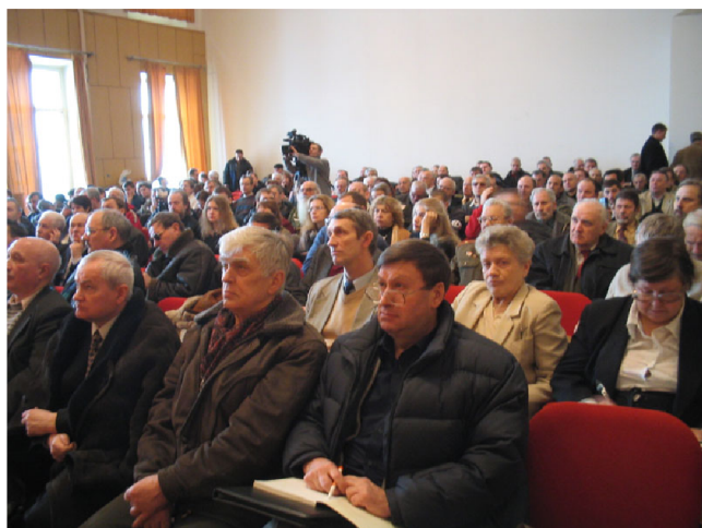
Зал был полон. Присутствовали 300–350 участников со многих регионов России и зарубежья.