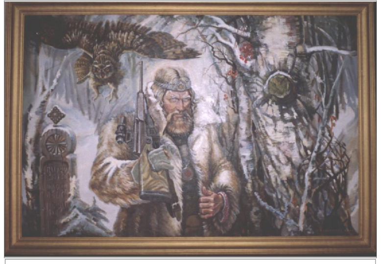
Картина воронежского художника Ю.Золотарёва